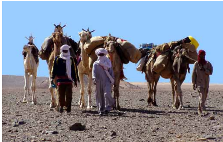
Tuareg-Nomaden in der Sahara-Wüste

Die Viehhaltung nomadischer Hirtengesellschaften zeichnet sich durch eine extensive Nutzung der Ressourcen aus. Grasens jedoch zu