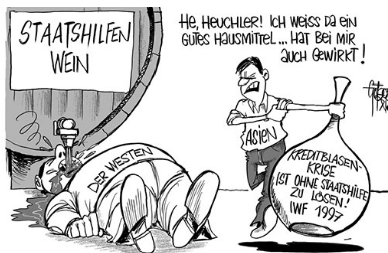
Eine alte Wasserflasche kommt wieder zu Ehren

Wirtschafts-Karikatur "Wiedenroths Vorbörse" zum Thema: IWF grundsätzlich gegen Staatshilfen für notleidende Banken - 1997, in Asien