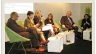
Die deutsche Sprache stärken - über die Grenzen hinaus: Podiumsdiskussion zu Deutsch als Fremdsprache