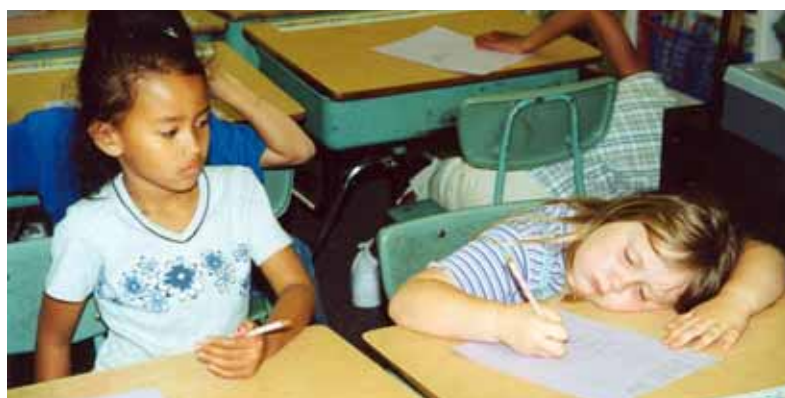
Faul bin ich nicht - ein bisschen müde...