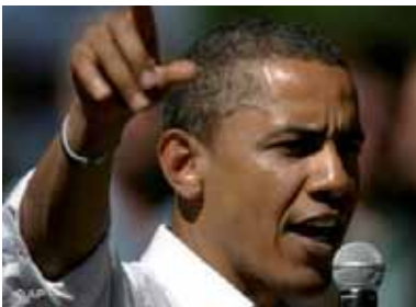
Er möchte die Gepflogenheiten in Washington ändern: Barack Obama