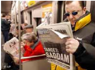
Gehört das Bild des zeitungslisenden Amerikaners bald der Vergangenheit an?

Auch das Verlagshaus "Gannett", in dem unter anderem die nach wie vor erfolgreiche "USA Today" erscheint, wird