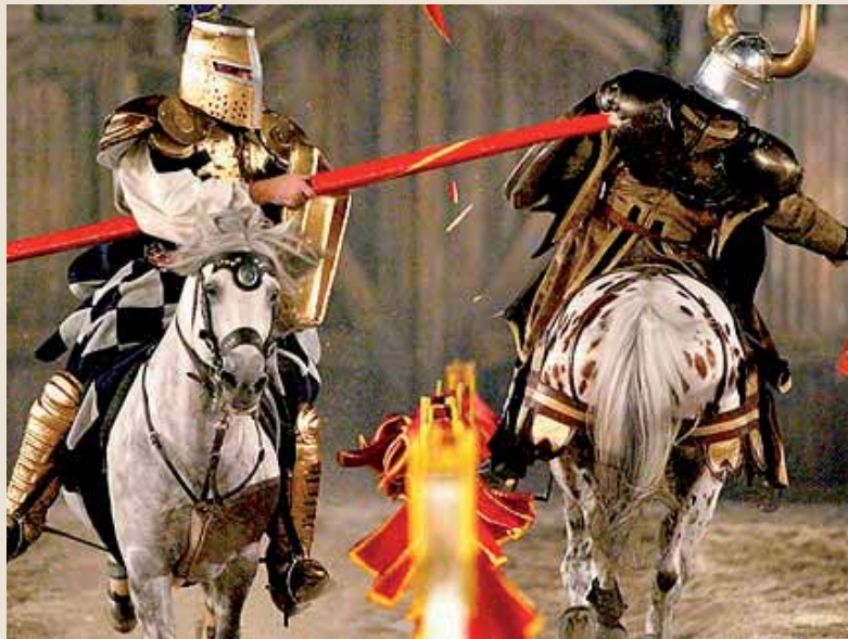
Auch heute: Jeder kämpft für sich allein. Den Preis kriegt der Stärkste