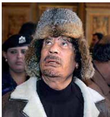
Muammar al-Gaddafi in russischer Pelzmütze

Während des Staatsbesuchs, in dessen Mittelpunkt Rüstungskäufe stehen, werde Gaddafi auch mit dem russischen Präsidenten Dmitri Medwedew zusammentreffen, meldete die Agentur Interfax unter Berufung auf den Kreml. Nach einem Bericht der Wirtschaftszeitung „Kommersant“ (1. November) ist Libyen bereit, in seinem Hoheitsgebiet auf Wunsch Moskaus eine Basis der russischen Kriegsflotte einrichten zu lassen. Laut Moskauer Medien will Gaddafi auch mit der Ukraine über eine militärische Kooperation verhandeln. Der 66-