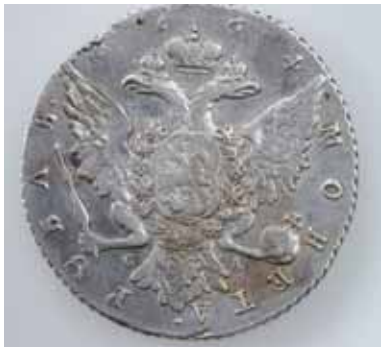
Russischer Soldat verlor 1799 mit dem Katharinen-Rubel einen Wochenlohn.

Die Kantonsarchäologie Zürich vermutet, dass ein russischer Soldat den Rubel verlor, als er mit General Suworows Armee 1799 gegen Napoleon durch die Schweiz zog. Das Stück sei wohl durch das Umpflügen des Ackers an die Oberfläche befördert worden, erklärte Kantonsarchäologin Renata Wind-