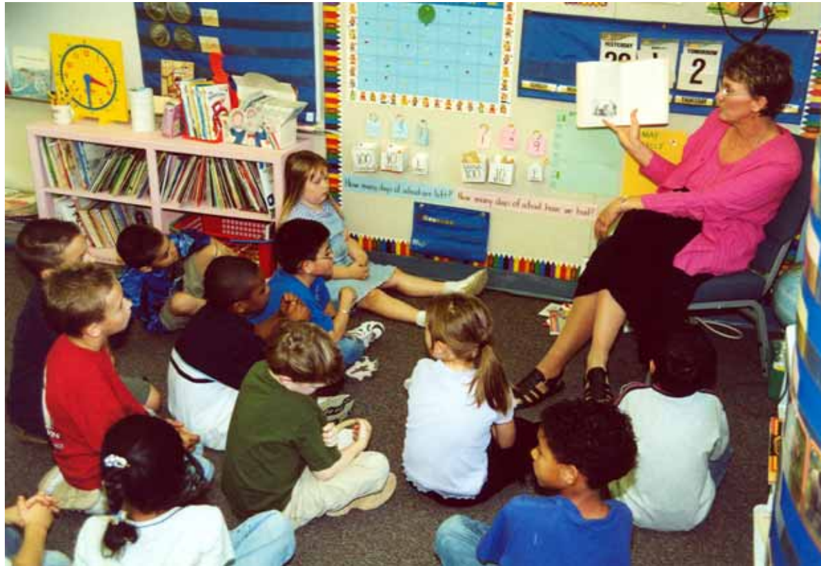
Im Unterricht an der Schule in Kalifornien (USA) wird das Thema «Deutsche Märchen» behandelt

Da sieht man eben auch krasse Unterschiede im Schulsystem. Wenn in Bayern (Deutschland) und im Gebiet Omsk (Russland) die 10-jährigen leistungsabhängig in die Schulformen einsortiert werden, haben ihre schwedischen Altersgenossen noch nie ein Zeugnis zu Gesicht bekommen: Noten gibt es in Schweden erstmals in der achten Klasse! Bei uns in Russland wer-