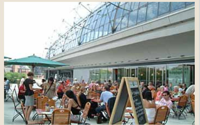
Berlin. Am Hauptbahnhof