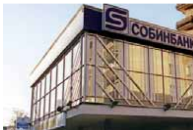
Das russische Bankensystem leidet stark unter der Krise

Umgerechnet über 70 Milliarden Euro hat die russische Regierung im vergangenen Monat zur Stützung des Bankensystems bereitgestellt. Weitere 50 Milliarden Dollar bekam die staatliche Außen-