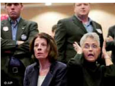
John McCain erkennt seine Niederlage an. Entsetzte McCains Anhänger in Ohio

Chicago (dpa) - Der Demokrat Barack Obama wird als erster Afro-Amerikaner ins Weiße Haus einziehen. Der 47-Jährige vereinte bei der Präsidentschaftswahl mehr als die 270 notwendigen Wahlmänner hinter sich. Der Kandidat der Republikaner, John McCain, gratulierte Obama und gestand seine eigene Niederlage ein. Vor mehreren zehntausend Anhängern in Chicago stimmte Obama die Öffentlichkeit auf einen schwierigen Weg ein. Er beginne seine Regierung in einer Zeit immenser Herausforderungen. Obama kündigte an, er wolle Gegensätze in der US-Gesellschaft überwinden und sich für die nationale Einheit einsetzen. McCain forderte seinerseits in einer Rede in Phoenix im Bundesstaat Arizona seine enttäuschten Anhänger auf, dem künftigen Präsidenten dabei zu helfen, notwendige Kompromisse zu schließen.