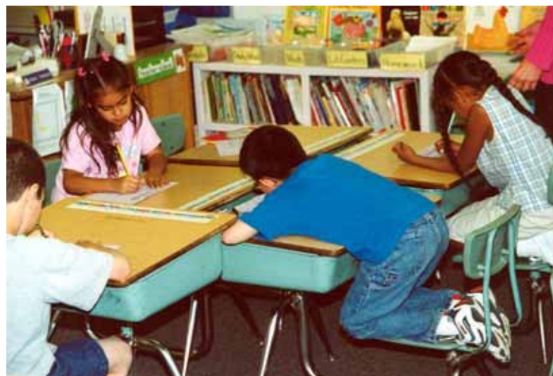
Frei und locker denken, handeln und... sitzen

nicht von vornherein festgelegt, doch am Ende der Woche muss die Lehrerin die Erfolge abzeichnen.