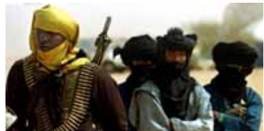
Seit Monaten ist die Nordhälfte von Niger Kriegsgebiet, doch im Land wird über die Revolte der Tuareg-Nomaden in der Sahara-Wüste nur leise gesprochen.

Dieser Stand der Dinge sollte zu einer Erforschung und Förderung von Viehhaltungspraktiken anre-