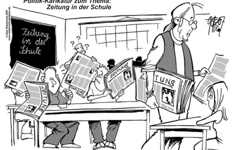
“Eh, Mann, wo hat das Ding denn seinen Kopfhöreranschluss?”