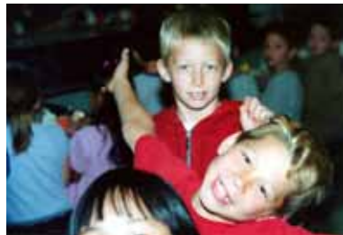
Lustig und spannend kann auch das Schulleben sein

Deutschland eingefordert werden, gibt es in Schweden längst. Die Resultate des landesweiten Leistungstests unter Neunklässlern werden nach Schulen aufgeschlüsselt