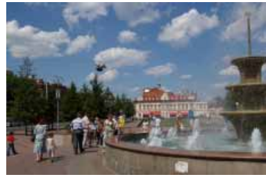
Der Nowosobornaja-Platz in Tomsk