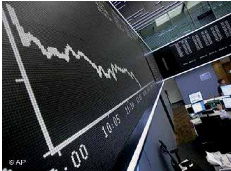
Immer wieder setzen die beiden Moskauer Börsen derzeit ihren Handel aus