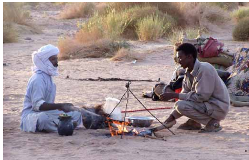
Das ruhige Abendessen in der Sahara-Wüste

viele Tiere auf zu geringem Weidgrund, so wird dieser übernutzt. Desertifikation ist die Folge. Dazu kommt die Umwandlung von großen Weidearealen in Ackerland. Die Nomaden haben nicht mehr genügend Land für ihre Tiere und müssen sesshaft werden. Die Ausweitung der Felder führt zu Konflikten zwischen Bauern und Nomaden. Konsequenzen des Klimawandels für das Leben der Nomaden sind folglich die Tendenz zur Sesshaftwerdung, die unaufföhrlich steigende Viehsterblichkeit und massive Landflucht vor den immer schwieriger werdenden Lebensbedingungen.