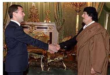
Dmitrij Medwedew und Muammar al-Gaddafi in Moskau

„Libyen muss seine zu Sowjetzeiten und in den vergangenen Jahren gekaufte Technik modernisieren“, erklärte Lawrow. Laut einem Bericht der Zeitung „Wremja Nowostej“ will Gaddafi nach seinem Treffen mit Medwedew und Putin eine Reihe anderer ehemaliger Sowjetrepubliken besuchen. Auf dem Plan stehe ein Besuch bei der weißrussischen Führung in Minsk, berichtete das Blatt unter Berufung