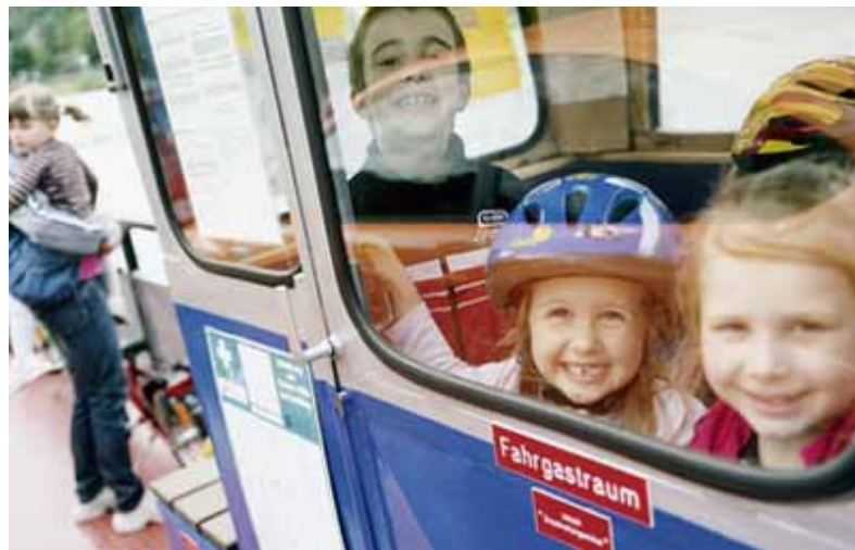
Flussfahrt, die ist lustig. Viel lustiger als der Schulbus...

keinen Führerschein für die Dieselfähre. Seitdem spielt sich sein Leben fast jeden Tag auf 24 mal sechs Metern ab, so groß ist das Boot. Hörnigs Rasierwasser, der Schiffsdiesel - das riecht nach Arbeit und Stolz. Es riecht, als sei der Fährmann eins geworden mit der Fähre, mit der Umgebung. Seine Elbseg-