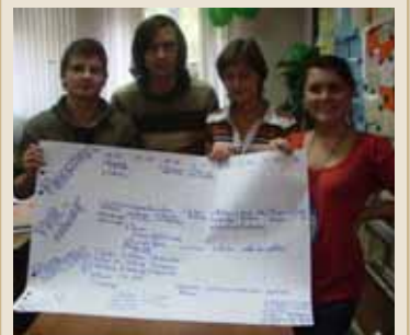
Projektentwurf zum Erntedankfest.

Im praktischen Teil ging es um Fragen von Projektmanagement und -finanzierung. Bei Organisation und Durchführung von internationalen Jugendbegegnungen, aber auch bei Kulturprojekten stehen Verfahrenweisen und Wege des Projektmanagements im Mittelpunkt. Ein Überblick über Fördermöglichkeiten rundete das Thema ab. Zwei Tage lang arbeiteten die Teilnehmer an Konzepten und Projektideen, etwa an gegenseitigen Auftritten von Musikern, an einer Studentenbegegnung und an einem Projekt für junge Historiker.