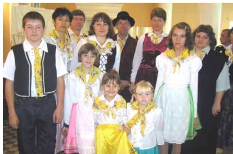
Die Familien Wins und Tews aus dem Dorf Ananjewka der deutschen Nationalrayon Halbstadt sind ständige Teilnehmer des Festivals

In der Altairegion fand das Festival der künstlerischen Familienensembles der Deutschen Russlands statt