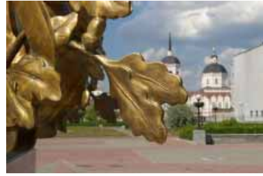
Der Lenin-Platz in Tomsk.

wissen, ob sie über die Ereignisse des 28. August 1941 Bescheid wissen. Wenn jemand überhaupt nichts damit anfangen konnte, haben wir es ihm erzählt und ihn ins Haus der Völkerfreundschaft eingeladen, in dem ein Film über die Deutschen in Sibirien gezeigt wurde.“