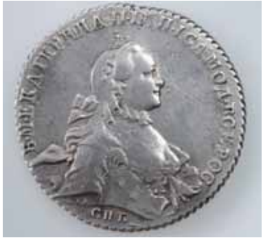
Das Stück wurde 1764 in Sankt Petersburg geprägt und zeigt auf der Vorderseite ein Brustbild der Herrscherin, auf der Rückseite den gekrönten Doppeladler

Die Vorderseite des Rubels von 1764 zeigt Katharina die Grosse mit umgelegtem Hermelin, das kyrillische Kürzel SPB steht für den Prägeort Sankt Petersburg. Die Rückseite zeigt den gekrönten Doppeladler mit Zepter und Reichsapfel in den Fängen. Im Wappenschild auf der Brust des Adlers bekämpft der Heilige Georg den Drachen und über den Adler-