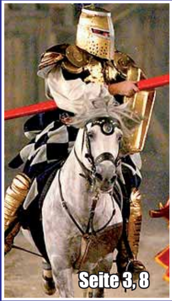
Seite 3, 8