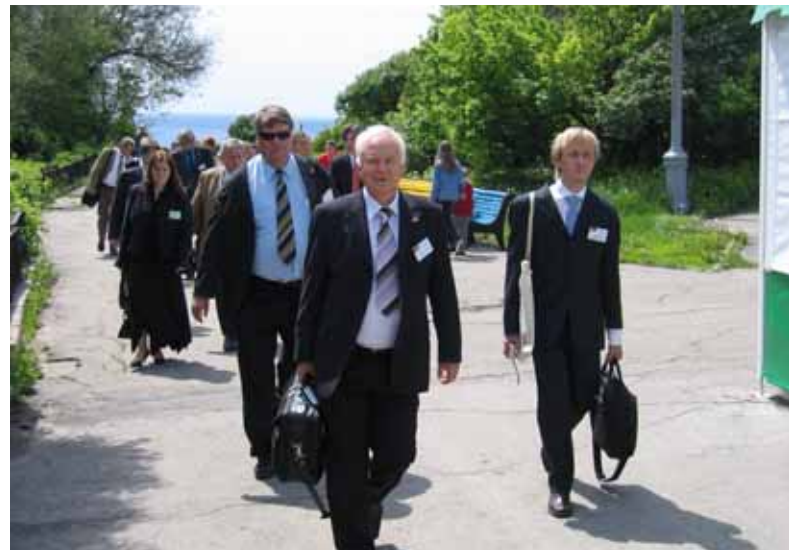
Die deutschen Unternehmer kommen auch nach Uljanowsk an der Wolga